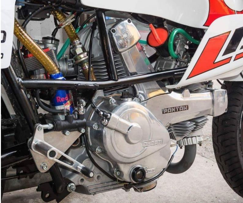
Foto muestra como SI han de ser presentadas las motos para esta competición.

Se permitirá que las tapas estén perforadas para que puedan refrigerar mejor. Pero no podrán tener un hueco mayor al dedo de una mano. Se recomienda que las tapas sean agujereadas con una broca no mayor a 8mm