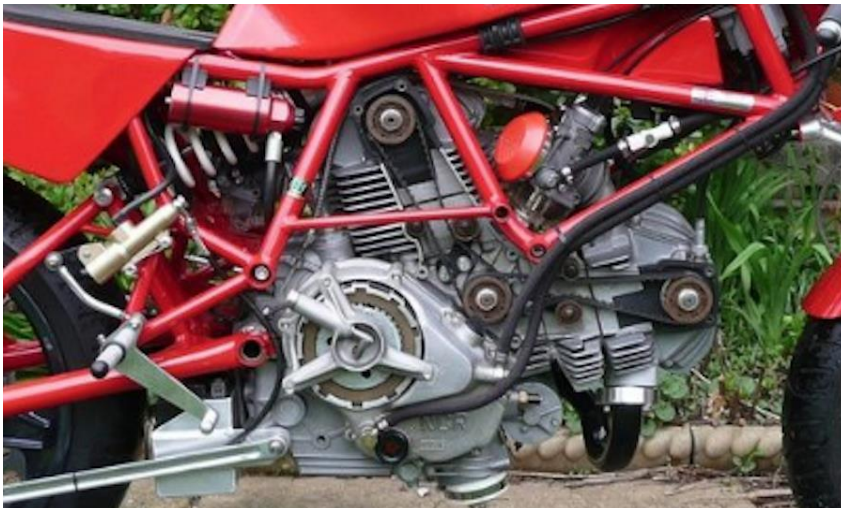
Foto muestra como NO han de ser presentadas las motos para esta competición.